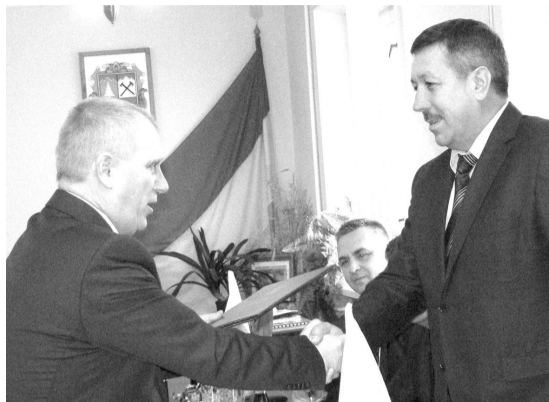
Л. БЕЗПАЛОВА. Фото автора.

Представники польської делегації запропонували косів'янам спів-