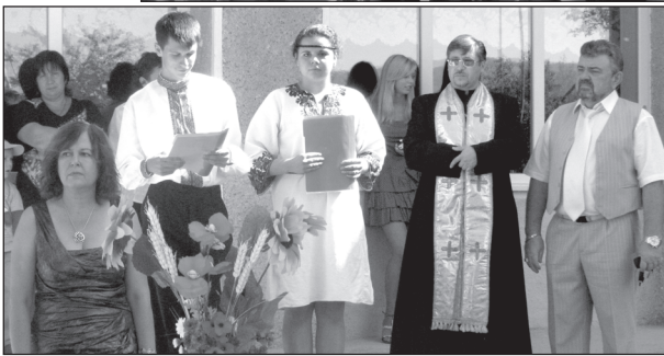
М. ДОЛИНЧУК. Фото автора.