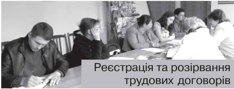
Реєстрація та розірвання трудових договорів

15 травня у приміщенні Косівського районного центру зайнятості відбувся семінар з приватними підприємцями «Про порядок реєстрації трудових договорів між підприємцями та найманими працівниками. Права, обов'язки та відповідальність роботодавців».