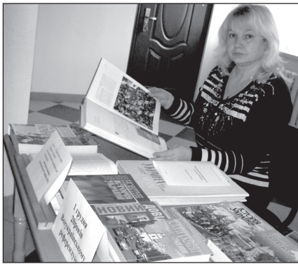
ставкою книг, яку підготували працівники районної бібліотеки.