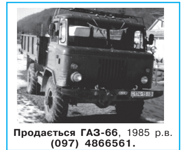
Продається ГАЗ-66, 1985 р.в. (097) 4866561.

Куплю невикористані БУДІВЕЛЬНІ МАТЕРІАЛИ . (097) 2325016.